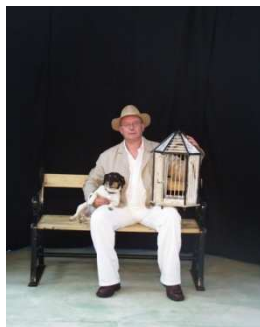
Barketins Teater: Møgfuglen

*I henhold til egnsteaterbekendtgørelsen kan et huslejetilskud på max. 15 % af det samlede offentlige drifts-tilskud ydes af staten svarende til kr. 1.050,-