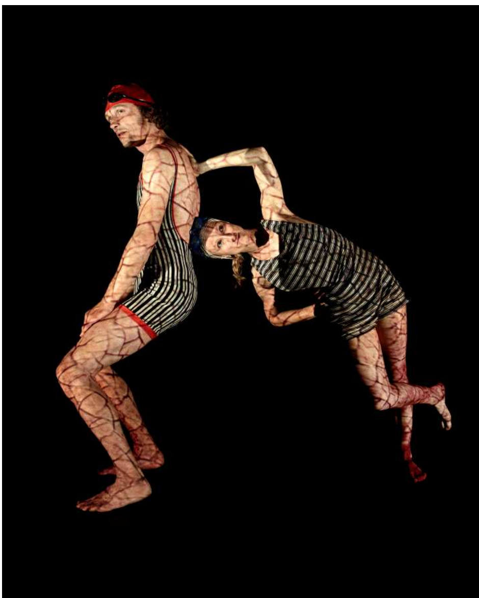
Carte Blanche: Vandspejling