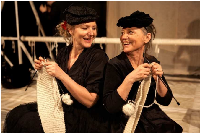
Teatret Møllen: Linedanseren