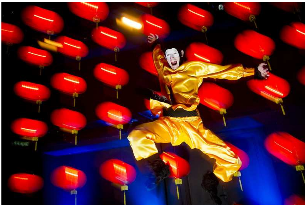
Mungo Park, Kolding: Abekongen

For egnsteater-aftaler og -evaluering af de enkelte egnsteatre , se bilag 6.