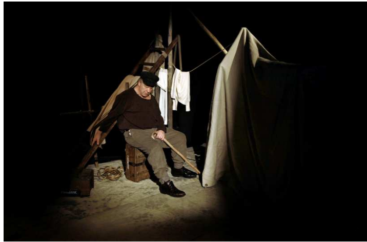
Randers Egnsteater: Hesten

Den nære beliggenhed ved "Værket" medfører samarbejde om både teknik og lokaler.