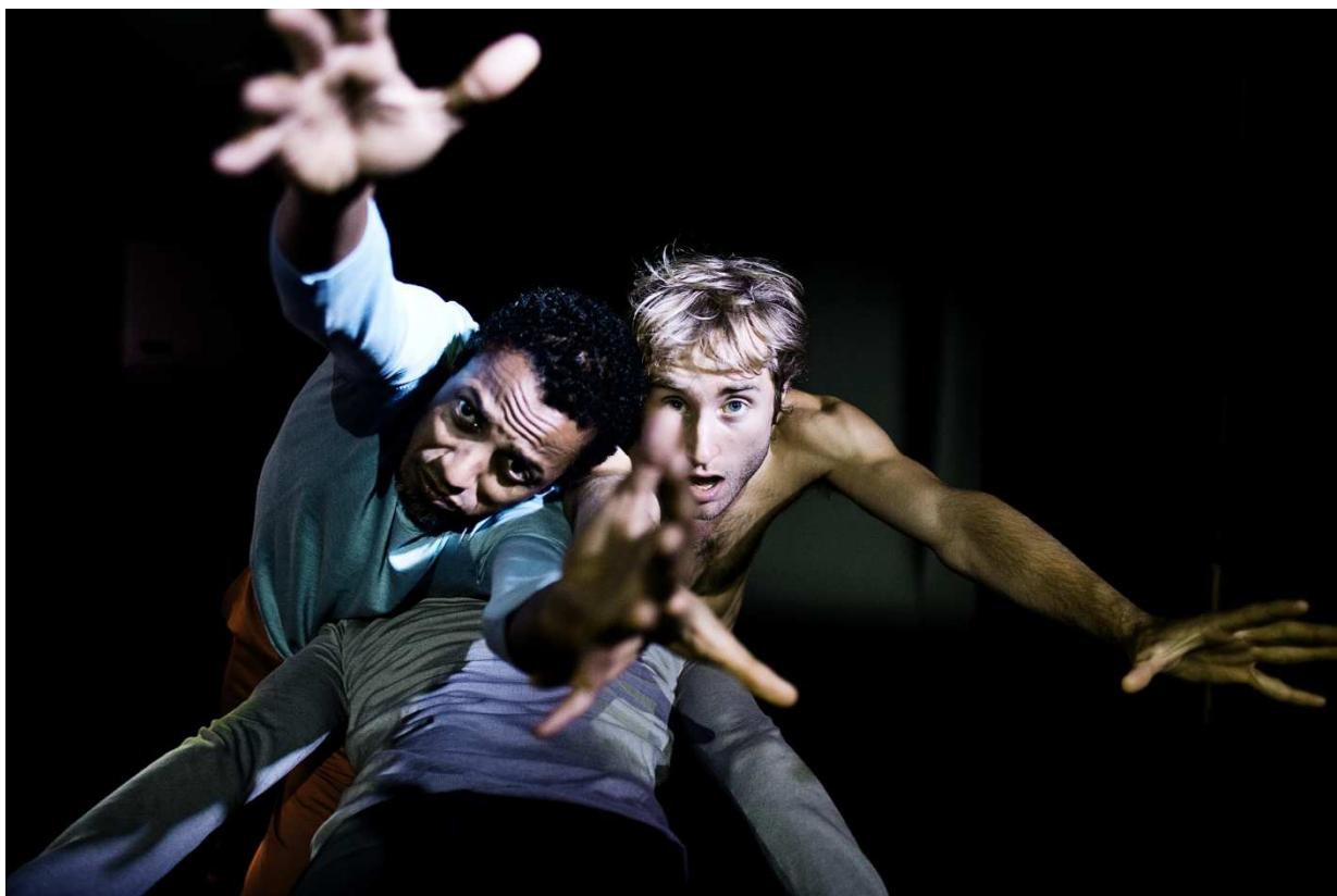
Åben Dans: Jeg ved, hvor din hus den bor.