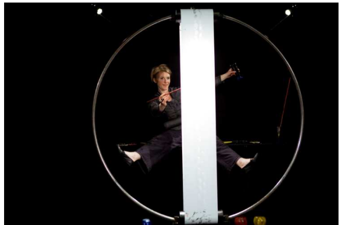
Teater Blik: Vejen Rundt

Et egnsteater med fast ensemble som kan skabe og videreudvikle teatrets kunstneriske profil og kulturpædagogiske virke og tilknytning til region Vadehavet.