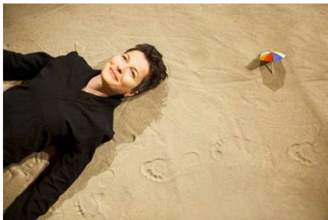
Teater MY: Små Skridt

Alle adspurgte ser det som en markant værdiforøgelse for kulturlivet i vores region og som meget berigende for det scenekunstneriske miljø. Det vurderes, at et professionelt producerende teater vil højne fagligheden og dermed skabe et langt bredere publikumsunderlag. De fleste sparringspartnere ser mange samarbejdsmuligheder mellem deres daglige aktiviteter og et kommende egnsteater. Således ser sparringspartnerene et egnsteater som en potentiel kulturel dynamo, som vil kunne fungere som en brobygger mellem forskellige dele af kulturlivet, bl.a. mellem amatører og professionelle.