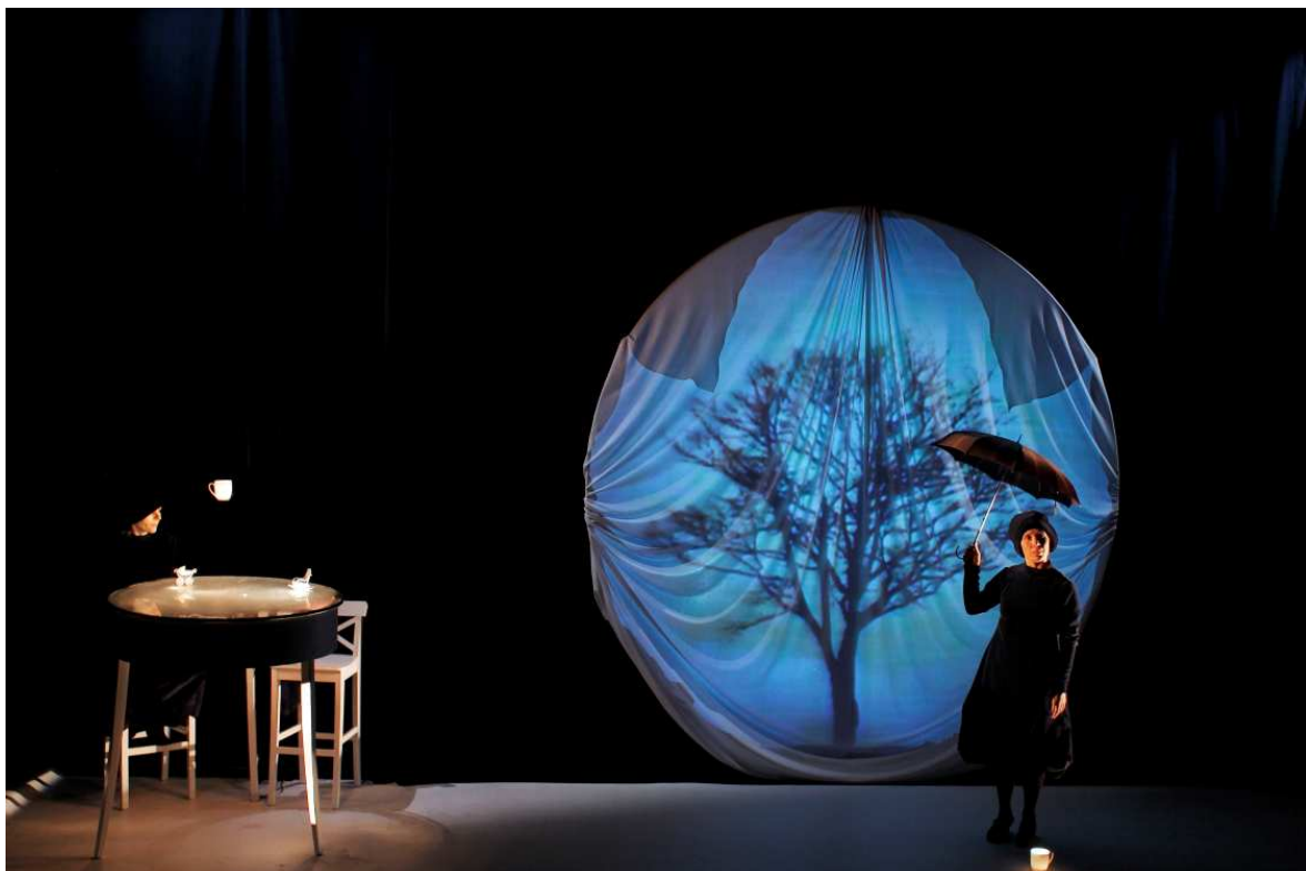
Carte Blanche: Skyggen af tid

Dette medfører 2 forskellige organisationsformer, som ikke uden videre er forenelige.