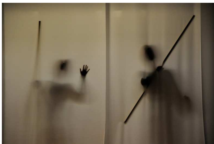
Teater Grundkurset, Esbjerg Kulturskole: Mutant

Det har været vigtigt for styregruppen at undersøge så bred en vifte af sparringspartnere som muligt for at opnå den bedst mulige lokale/regionale forankring og ejerskab til et kommende egnsteater.( Se bilag 1 )